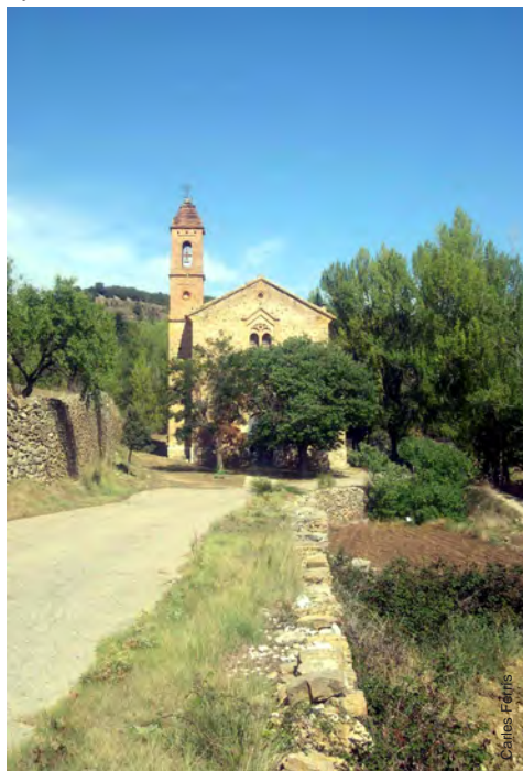
Ermita Mare de Déu de Gràcia